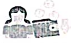
Child marriage reduces the future earnings of child brides by 9%