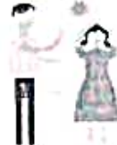
Child brides may have less decision-making ability in the household and face higher risks of violence

ప్రోగ్రామ్లో పాల్గొనేవారికి 18 ఏళ్లు నిండిన తర్వాత 2012 సంవత్సరంలో మహిళల పరిశోధన కోసం ఇంటర్నేషనల్ సెంటర్ అప్పీ బేటీ, అప్పా ధన్ను అంచనా వేస్తుంది, ప్రోగ్రామ్, ముఖ్యంగా నగదు ప్రోత్సాహకం, వారి కుమార్తెల వివాహాలను ఆలస్యం చేయడానికి తల్లిదండ్రులను ప్రేరేపించిందో లేదో చూడటానికి . . ." షరతులతో కూడిన నగదు బదిలీ కార్యక్రమాలు బాలికలను పాఠశాలలో ఉండడంలో మరియు వారికి రోగనిరోధక శక్తిని పొందడంలో చాలా ప్రభావవంతంగా ఉన్నాయని మా వద్ద ఆధారాలు ఉన్నాయి , అయితే వివాహాన్ని నిరోధించడానికి ఈ